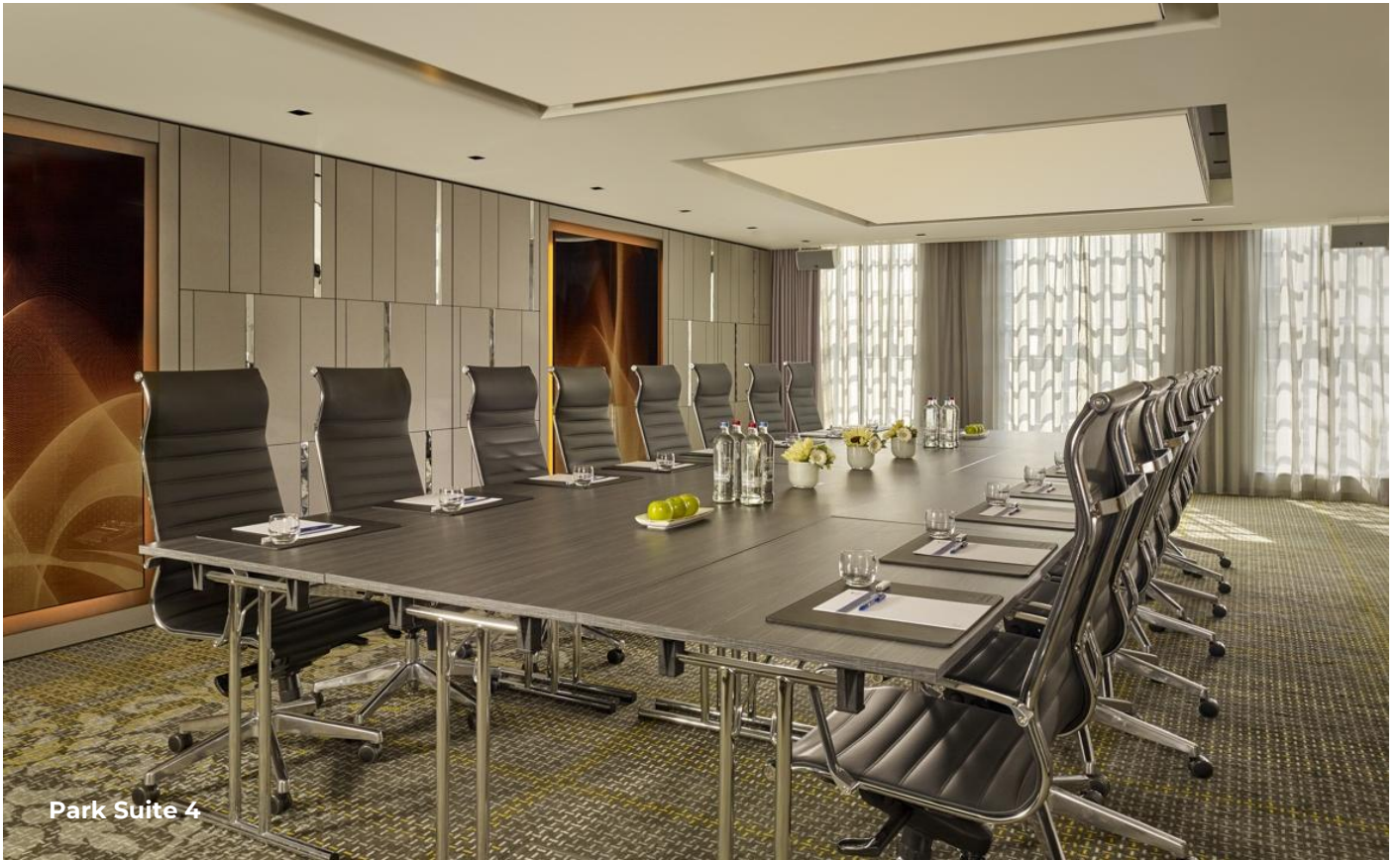
Park Suite 4