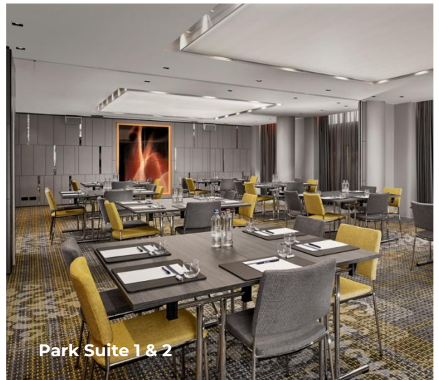
Park Suite 1 & 2