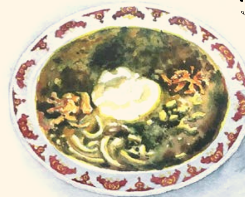
Ash E-Reshteh آش رشتة