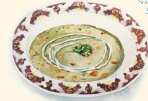
Soup E-Jo سوپ جو

Please note that some of our dishes contain allergens; please ask a member of the team and we'll be happy to explain.