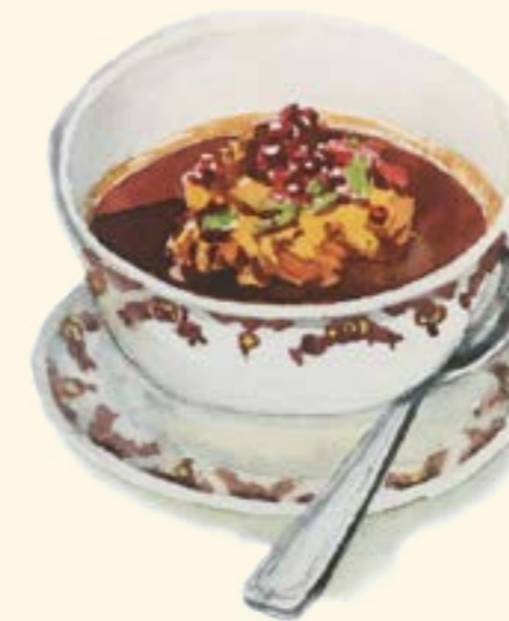
Kofta E-Tabrizi كفتة تبریزی

Lobia Polo 118 Iranian meat biryani with saffron marinated lamb meat