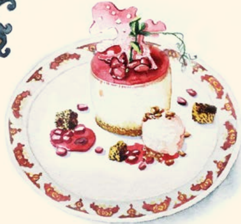
Anar Cheesecake چیزکیک انار

Please note that some of our dishes contain allergens; please ask a member of the team and we'll be happy to explain.