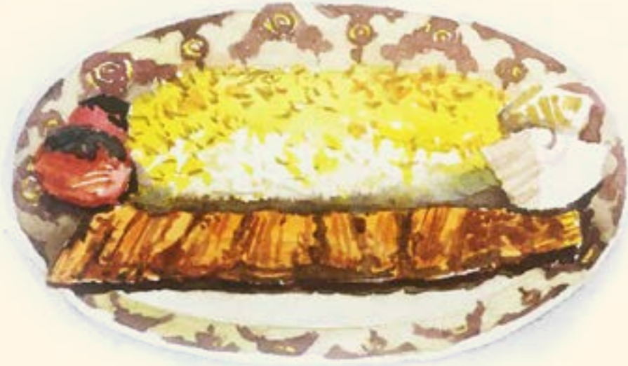
Chelo Kebab-E-Barg جلو كباب برگ

Please note that some of our dishes contain allergens; please ask a member of the team and we'll be happy to explain.