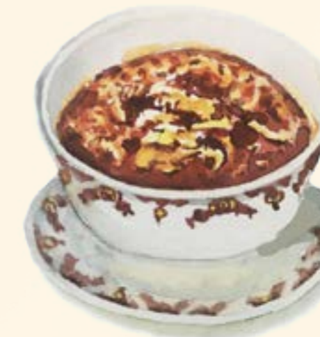
Khoresh E-Bamia خورشت باميه

لوبيا بولو ١١٨ برياني باللحم علي الطريقة الايرانية مع لحم الضأن المعتبل بالزعفران