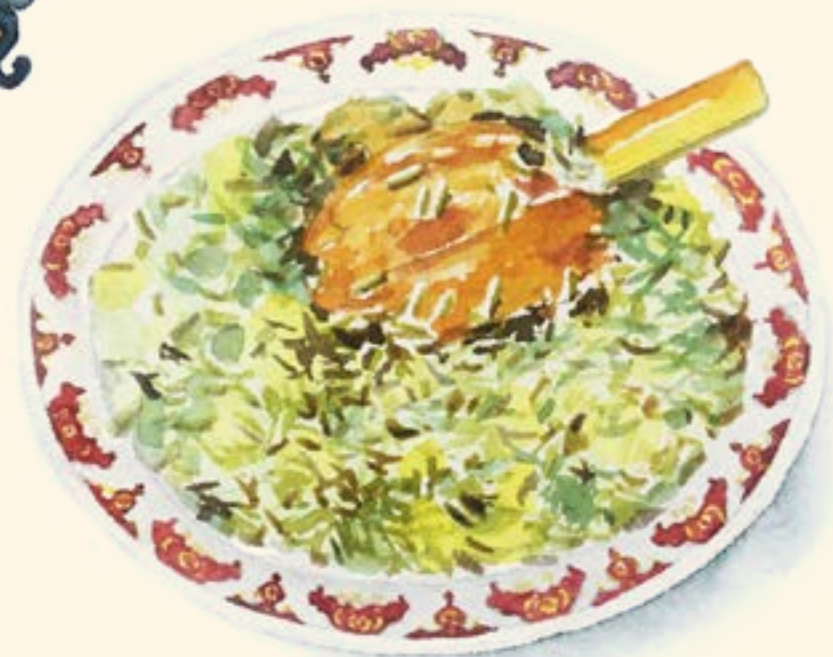
Baghalah Polo Ba-Mahichch ماهيچه

Please note that some of our dishes contain allergens; please ask a member of the team and we'll be happy to explain.