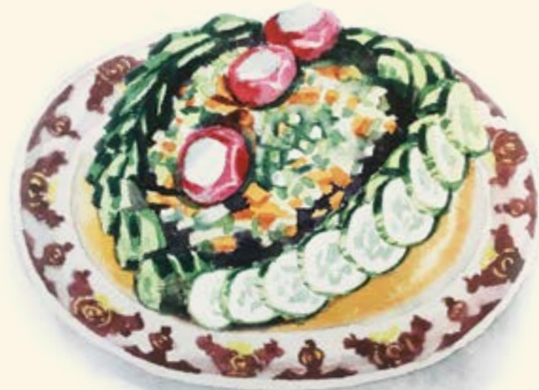
Salad-E-Shirazi سلاطة شيرازي