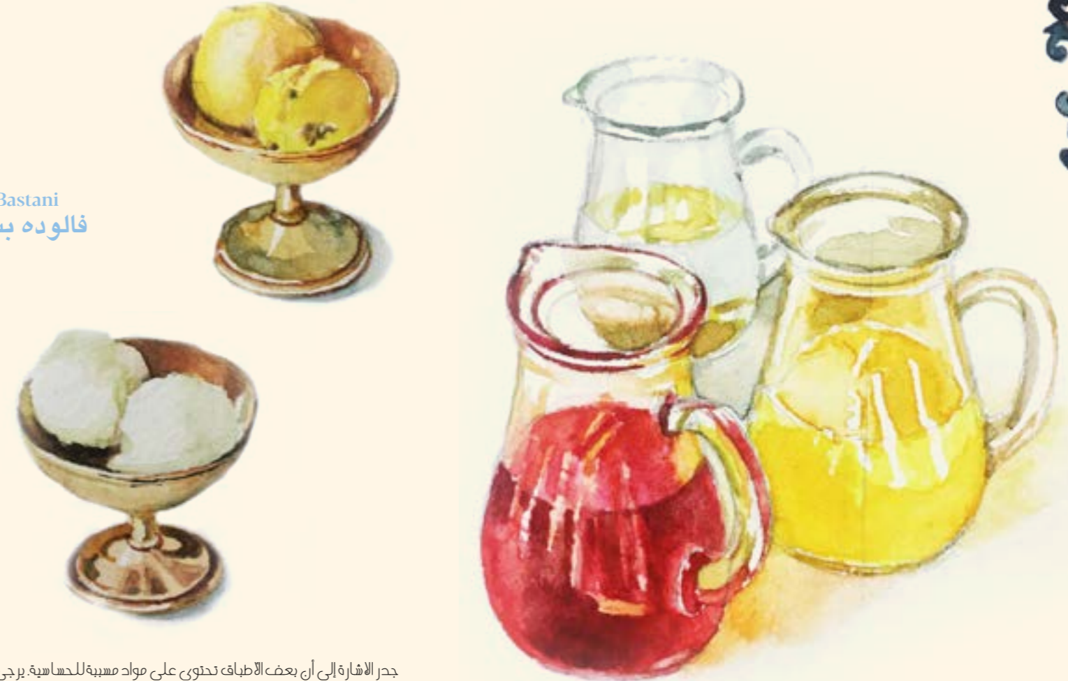
Faloodeh Bastani فالوده بستنی

جدر الإشارة إلى أن بعض الأطباق تحتوي على مواد مسببة للحساسية. يرجى الاستفسار من أحد أعضاء الفريق جميع الأسعار بالعملة المحلية وتشمل ٧٪ رسوم بلدية و ١٠٪ رسوم خدمة و ٥٪ ضريبة القيمة المضافة