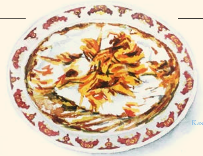
Kash E Bademjan كشك باذنجان