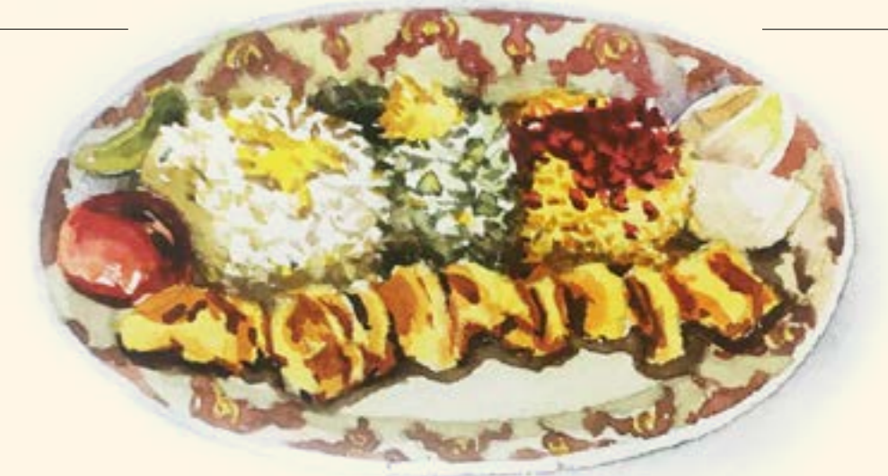
Chelo Kebab-E-Kubidch جلو كباب كوبيده

تيكه خودموني ١٥٠ مغامرة في المناطق الجنوبية من بندر عباس لتذوق هذا الطبق اللذيذ من لحم العجل أو الدجاج المنقوع في الكشك