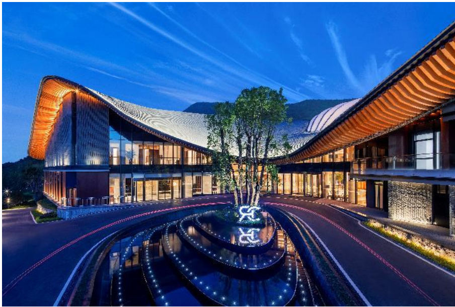
南京丽笙精选度假酒店

丽笙精选 是丽笙酒店集团旗下的标志性生活时尚酒店品牌，日前在南京开设了一家全新度假酒店，从而进一步拓展其在华业务。这家优雅时髦的五星级酒店坐落于规模宏大的综合旅游景区——江苏园博园内。