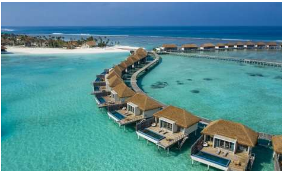
画面：马尔代夫丽笙度假酒店鸟瞰图

丽笙(Radisson Blu)，作为超高端酒店品牌，空间设计时尚，为宾客提供个性化私属服务。近日，马尔代夫丽笙度假酒店(Radisson Blu Resort Maldives)盛大开幕。这家私人岛屿度假酒店位于 Alifu Dhaalu 环礁，是丽笙酒店集团在马尔代夫的首家酒店。