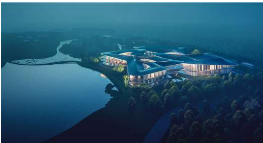
图片：南京丽笙精选度假酒店效果图

丽笙精选是丽笙酒店集团旗下标志性生活方式酒店品牌系列，将于明年携卓越的度假酒店首次登陆中国市场。该酒店亦是江苏省园博园内全新旅游综合体的重要组成部分。