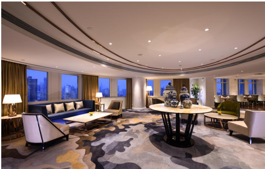
上海兴国宾馆丽笙精选行政酒廊